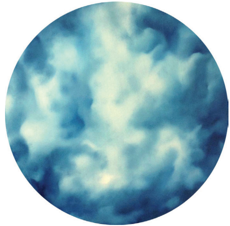
Projection Italie 2015. Tondo, Sophie Keraudren