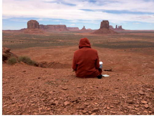
Projection internationale USA 2015, L'Empire comanche . Photo Michel Aubry