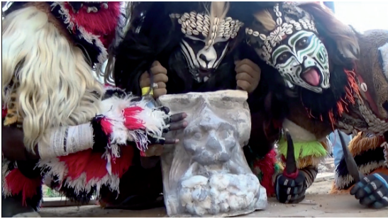
Projection Dakar 2015. Vidéostill Jean-Baptiste Janisset