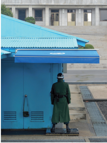
Projection Corée 2015. Sur la DMZ, checkpoint entre le Nord et le Sud.