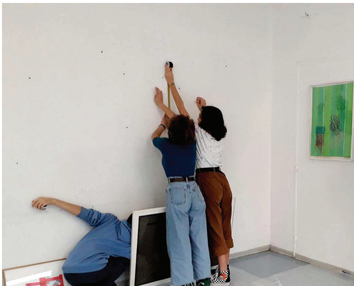
Séance d'accrochage au collège du Loroux Bottereau