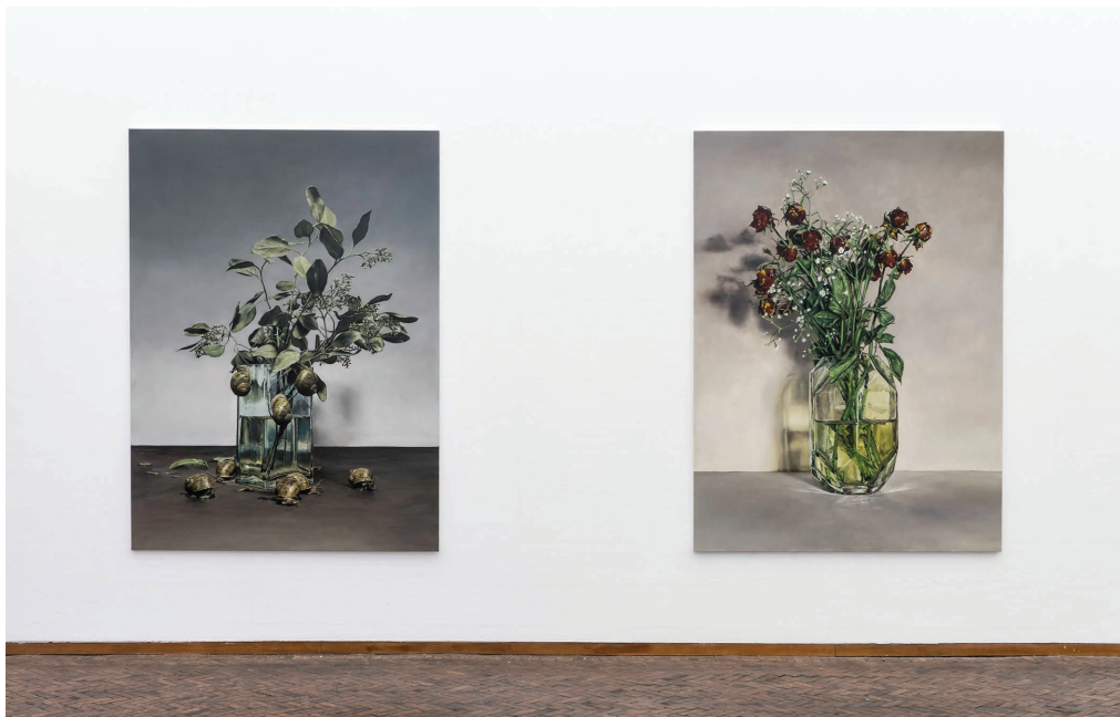
Vue de l'exposition Reigns de Damien Cadio, 2019, galerie Gerhard Hofland, Amsterdam.

Damien Cadio est un peintre aux tonalités sourdes et aux ambiances profondes. Partant souvent des images du quotidien, la peinture devient une entreprise du déplacement, de décentrement, par laquelle chaque chose se charge d'un poids inconnu. « Je cherche des images a priori banales – car encore une fois la violence n'est jamais loin – et l'attention à leurs détails fait surgir d'un environnement simple les indices d'événements extraordinaires ». Léa Bismuth, janvier 2012.